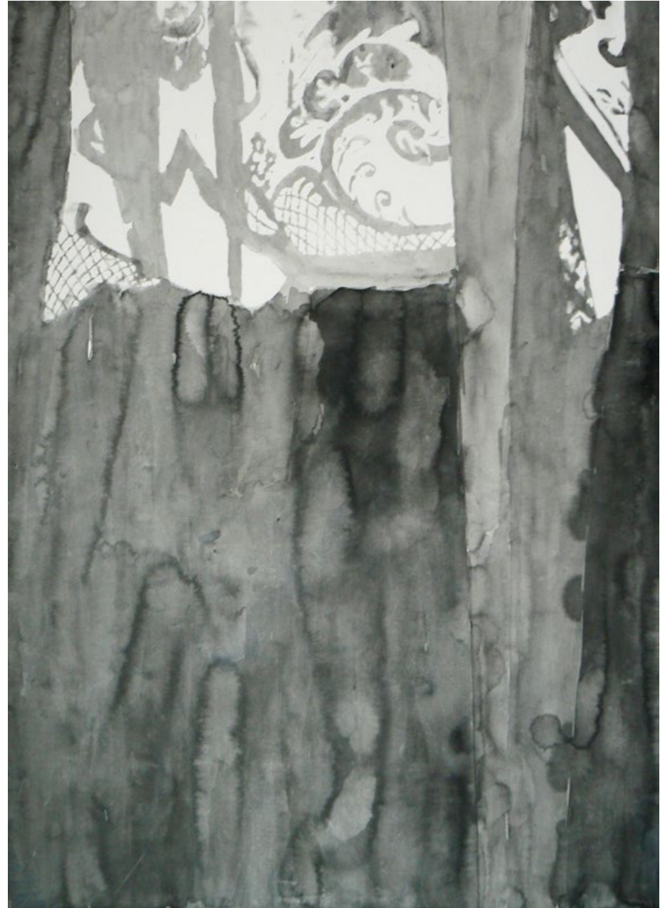
Z cyklu Záclony, tuš na papíře, 100 x 70 cm