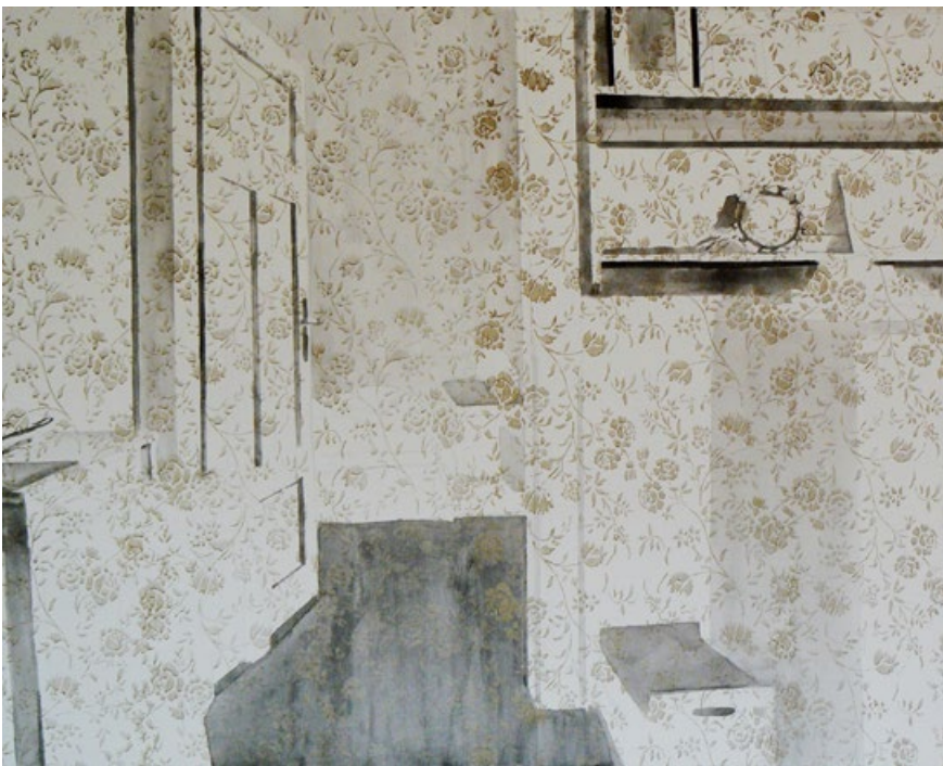
Úhel pohledu, tuš na plátně, 80 x 100 cm