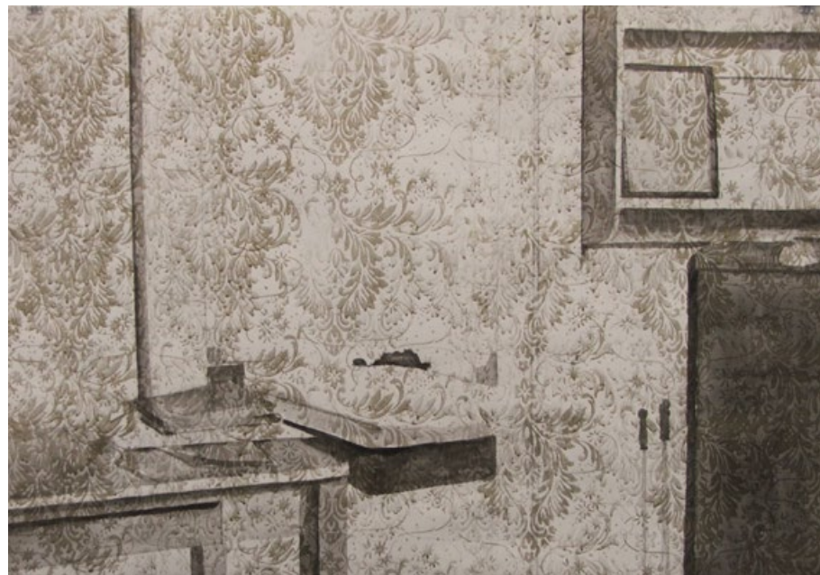
Úhel pohledu, tuš na papíře, 70 x 100 cm