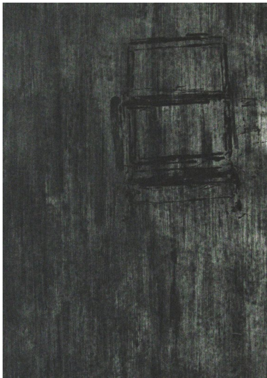
Stopy paměti, suchá jehla, lept, papír, 70 x 50 cm