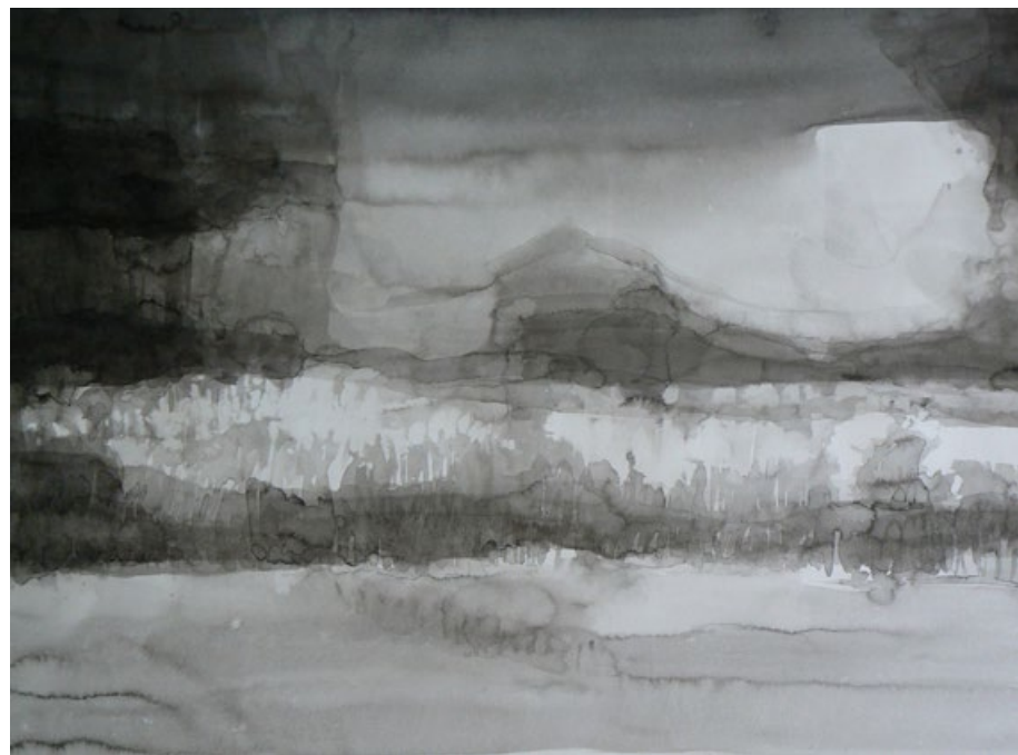
Dvě Staré krajiny, tuš na papíře, 70 x 100 cm a 50 x 70 cm