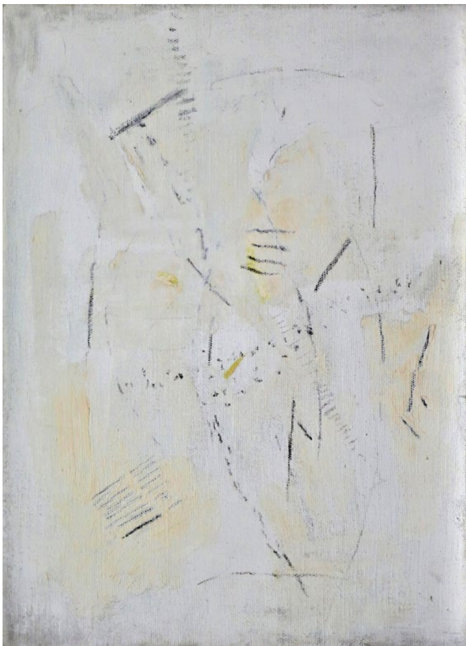
Záznam I, asi 2005, olej a tužka na plátně, 32 x 23 cm