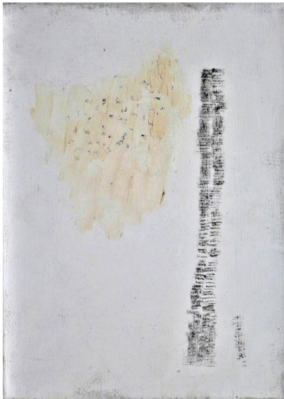
Záznam III, asi 2005, olej a tužka na plátně, 32 x 23 cm