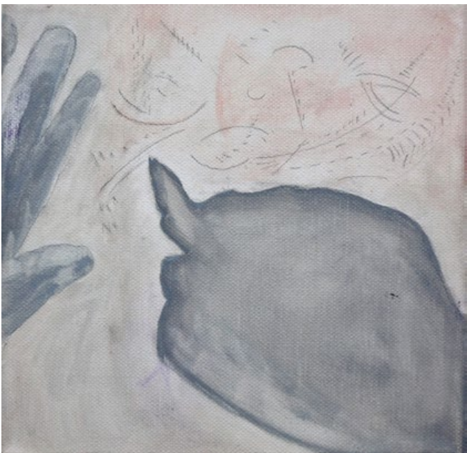
Můj svět, Ruce – Kreslení, 2018, olej na plátně, 25 x 25 cm