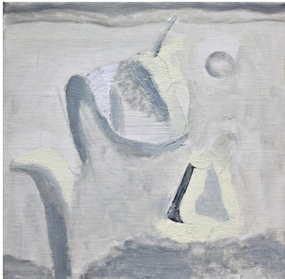
Můj svět, 2018, olej na plátně, 25 x 25 cm