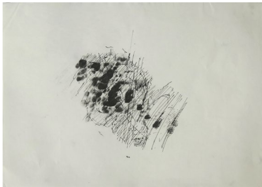
Bez názvu, asi 2005, tuš na papíře. 21 x 29,7 cm

Dcera navařila ted' zavírá okno ještě zavrzáni dveří utíká ze schodů Smaltovaná miska na polívku cvaknutí vypínače tolik světla všude