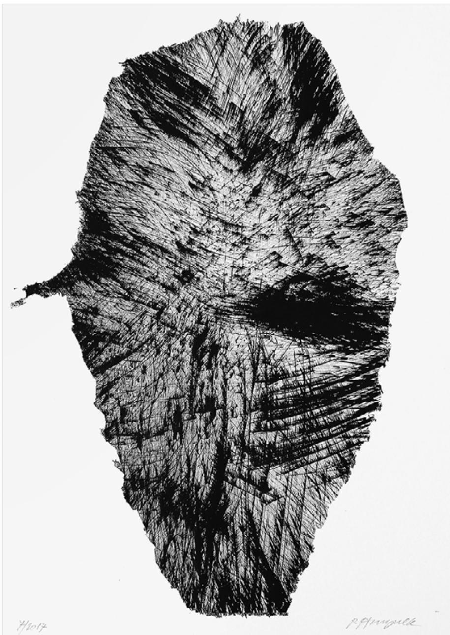
Pavel Herynek, Kámen 6, 2017, tuš, papír, 70 x 50 cm