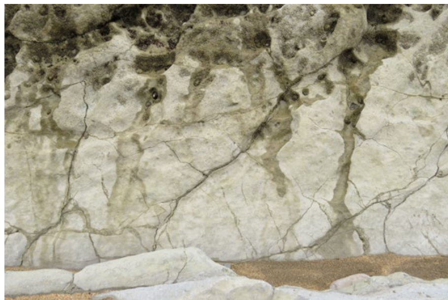
Hana Rysová, Španělsko, 2017, fotopapír, 30,5 x 45,7 cm