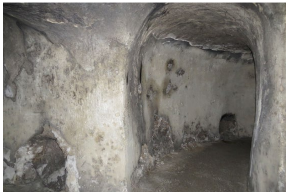
Hana Rysová, Jeruzalém, 2015, fotopapír, 30,5 x 45,7 cm