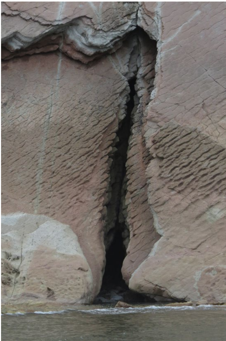
Hana Rysová, Španělsko, 2017, fotopapír, 45,7 x 30,5 cm