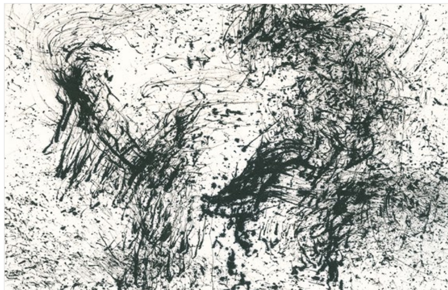
Pavel Herynek, Bez názvu, 2019, tuš, papír, 21 x 29,7 cm