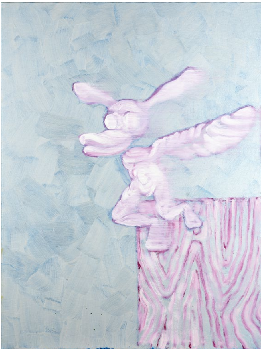
Bez názvu, 2020, olej, plátno, 80 x 60 cm