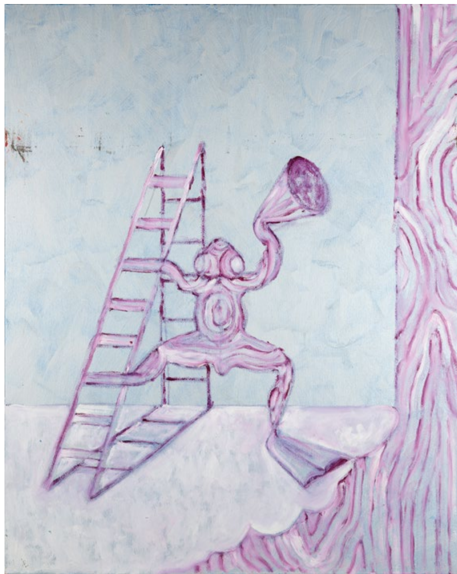
Bez názvu, 2020, olej, plátno, 100 x 80 cm