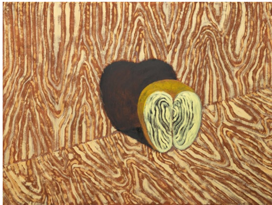
Bez názvu, 2020, olej, plátno, 60 x 80 cm

všemu tady vržou panty vše je vetché zteřelé v šeru svítí diamanty ticho jako v kostele v šeru září brilianty na mechu si ustelem