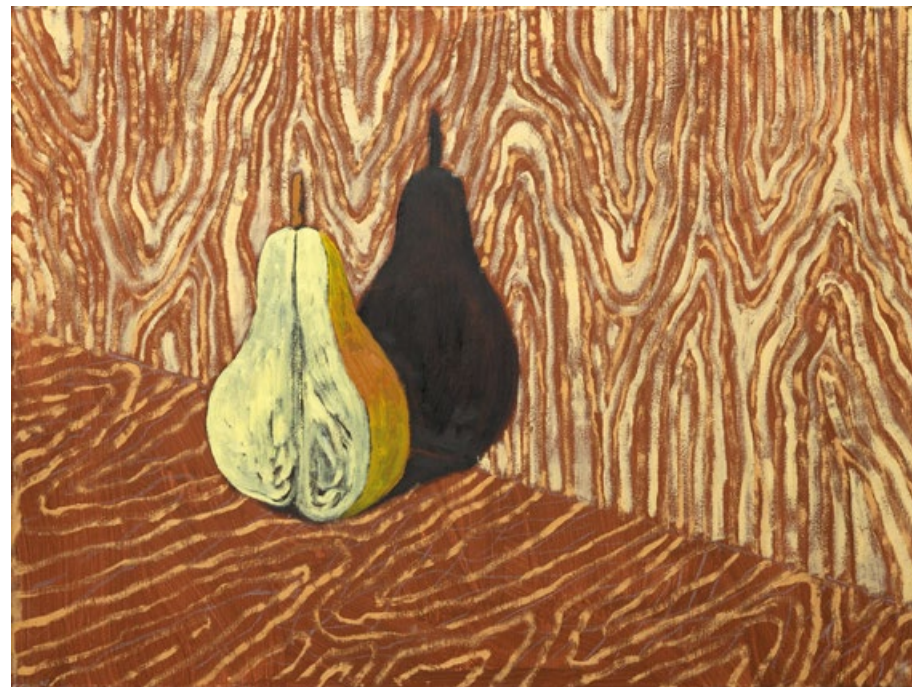
Bez názvu, 2020, olej, plátno, 60 x 80 cm