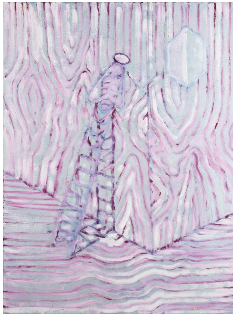
Bez názvu, 2020, olej, plátno, 80 x 60 cm