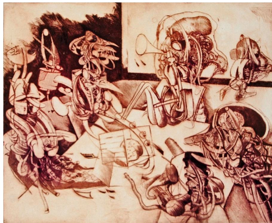
„Konzilium“, kombinovaná grafika

adresa: 273 73 Vraný č.53, okres Kladno telefon: 312 520 133 mobil: 604 716 883