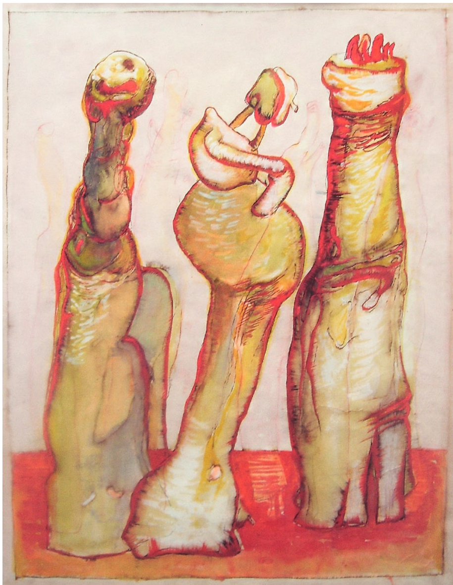
„Klíčení“, barevná kresba