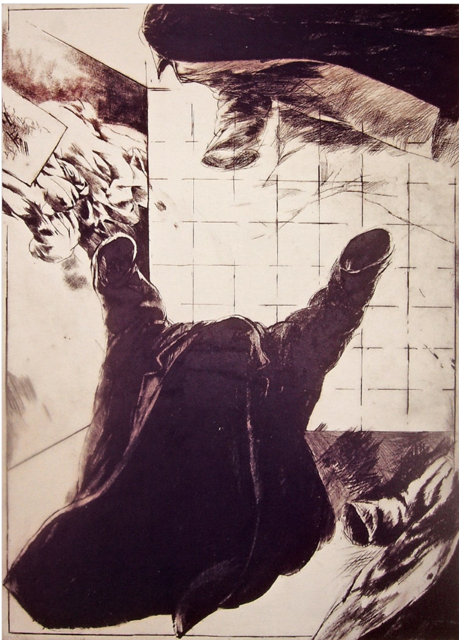
Z cyklu „Návraty“, suchá jehla