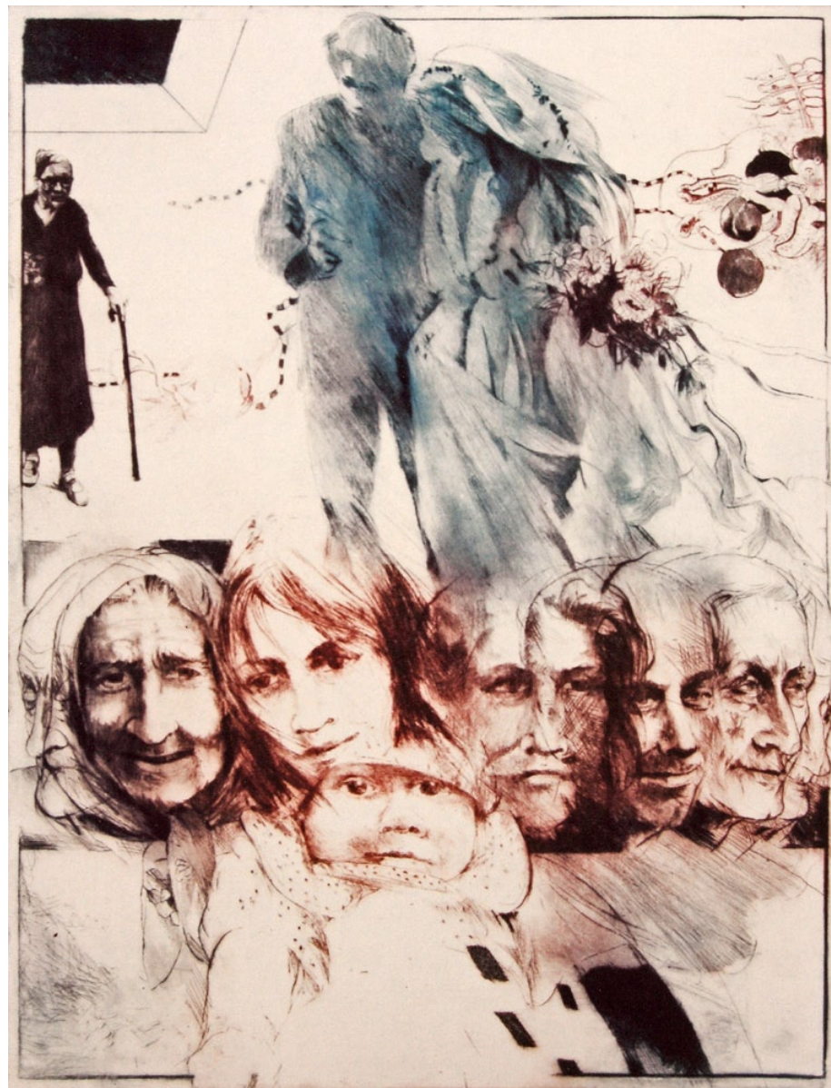
„Čas běží“, suchá jehla