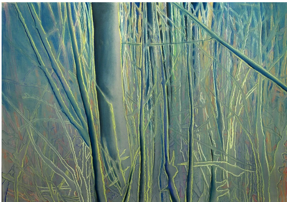
Námraza, 2009, pastel na papíře, 70 x 100 cm