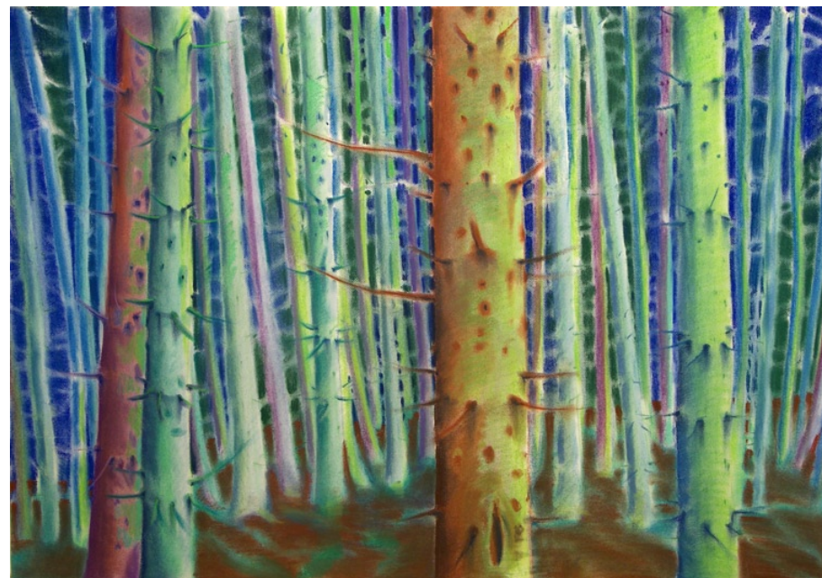
Kmeny, 2008, pastel na papíře, 70 x 100 cm