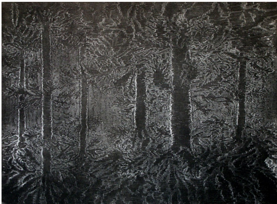
U zloděje, 2005, škrábaná akvatinta, papír; 60 x 80 cm