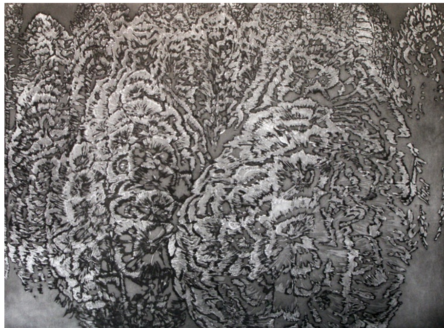
Olšoviště, 2005, škrábaná akvatinta, papír, 60 x 80 cm

Být jedno se vším, to je život božství, to je ráj člověka.