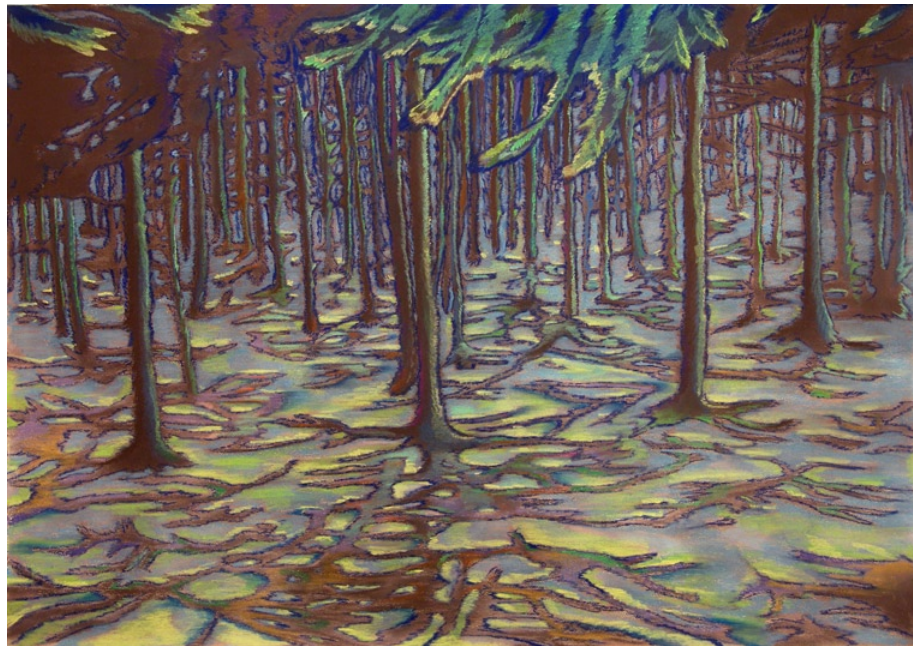
V zimě, 2008, pastel na papíře, 70 x 100 cm