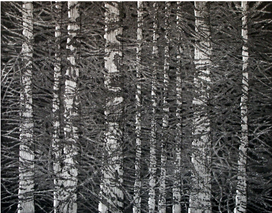
Modřiny, 2005, škrábaná akvatinta, papír, 60 x 75 cm