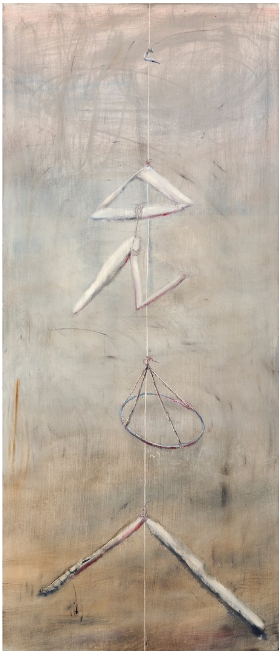
„Až do nebe“, 2011, olej na plátně, 140 x 60 cm