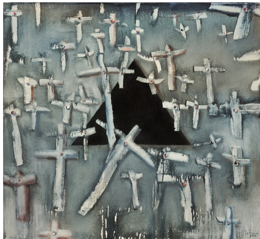
„Na prahu noci“, 2009, olej na plátně, 100 x 110 cm