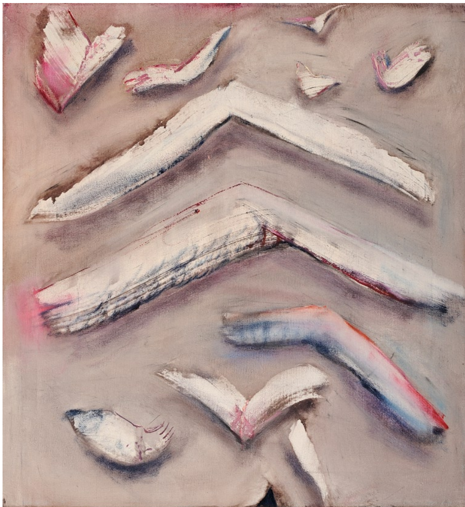
„Létání“, 2011, olej na plátně, 60 x 55 cm