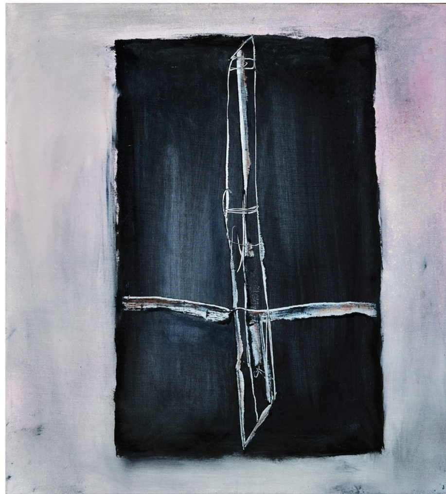
„Noc Svatého Petra“, 2010, olej na plátně, 100 x 90 cm