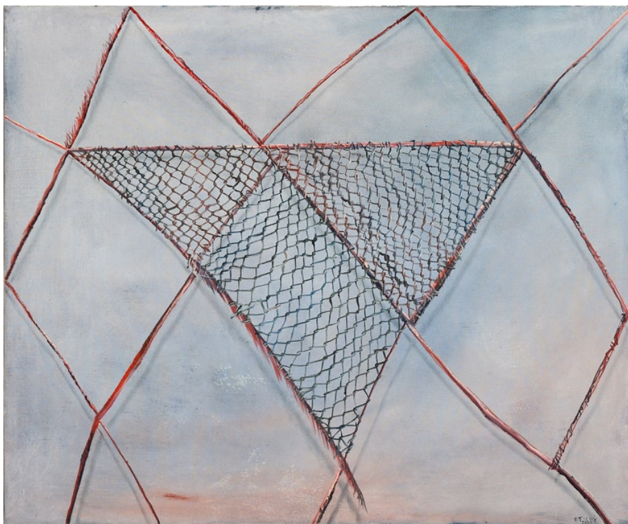
„Lapač“, 2009, olej na plátně, 99 x 120 cm