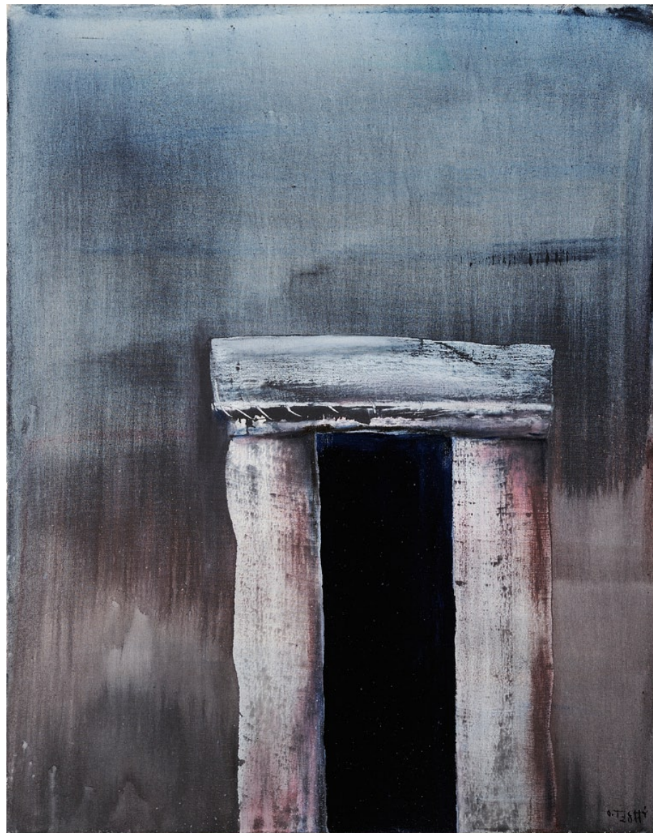
„Skrýš“, 2011, olej na plátně, 115 x 90 cm