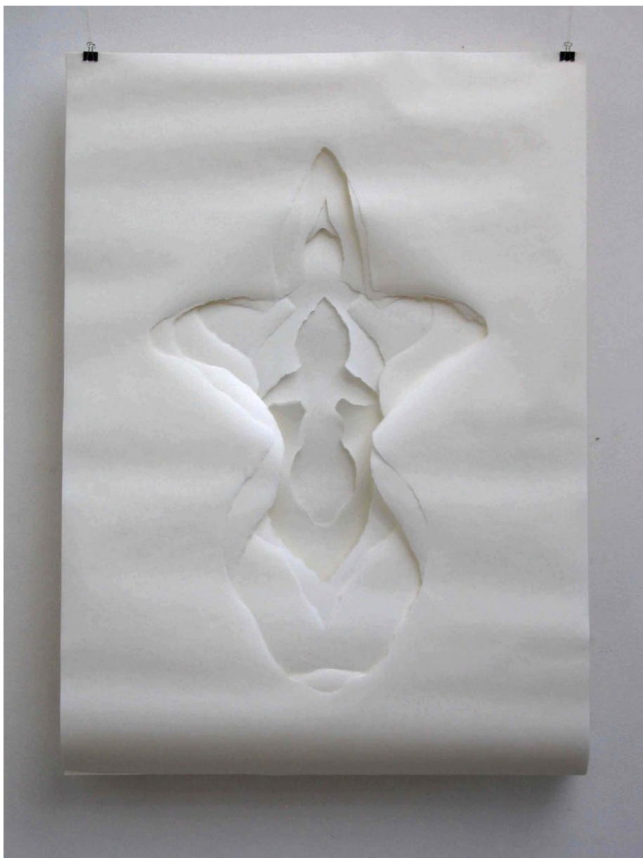
Papír, 2005, papír, 89 x 125 cm