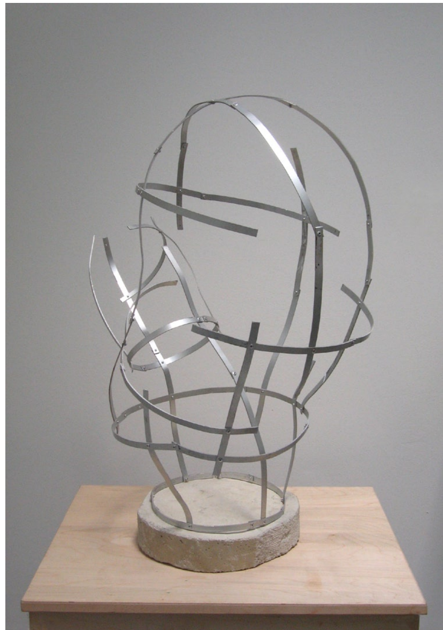
Kaktus, 2006, hliník, beton, výška 70 cm