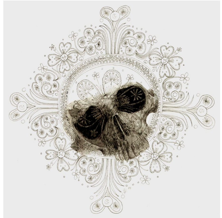
Bez názvu, 2003, čínská tuš, 29 x 29 cm

adresa: Čapkovská 42, 566 01 Vysoké Mýto mobil: 606 840 340 e-mail: mahos@centrum.cz