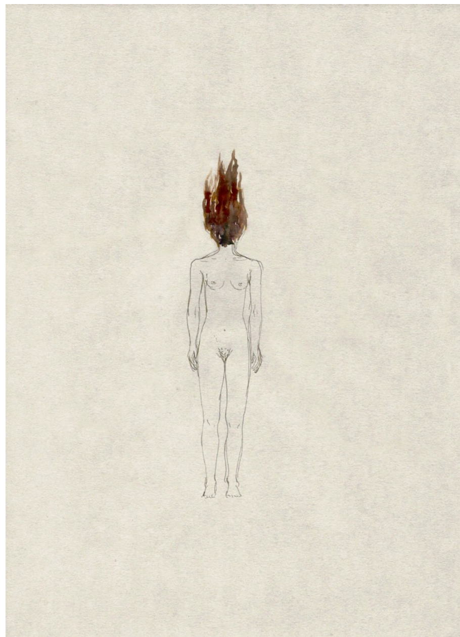
Kresba, 2003, tuš, akvarel, papír 42 x 30 cm