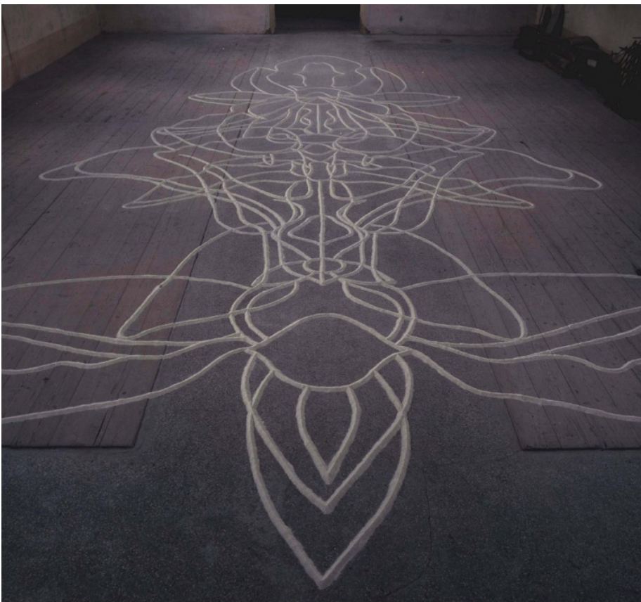
Synagogy květ (detail), 2003, písek, 6 x 11 m, Synagoga v Českém Krumlově

To, co vytvářím, jsou záležitosti převážně meditativní. Nemají ambici ohromit nebo něco podobného. Vlastně je to tak, že tvořit můžu až v prostoru, který dobře znám. Výstavu v Šumperku jsem nazvala „Od středu“. Inspiroval mě malý a uzavřený, symetrický prostor. I v mé tvorbě se občas vyskytne období, kdy mne symetrie přitahuje; asi ji nějakým způsobem potřebuji. Proto jsem pro tuto výstavu vybrala právě věci, které jakoby vznikaly z určitého středu a vyvíjely se dál svým vlastním životem, směrem od něj.