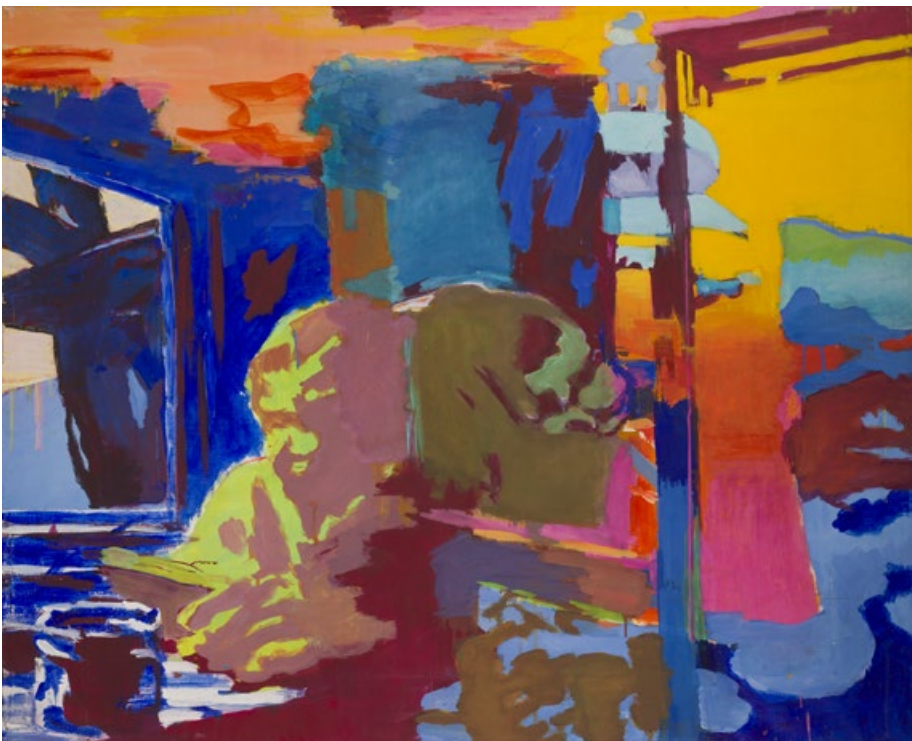
Večer, nedatováno, akryl, plátno, 110 x 135 cm