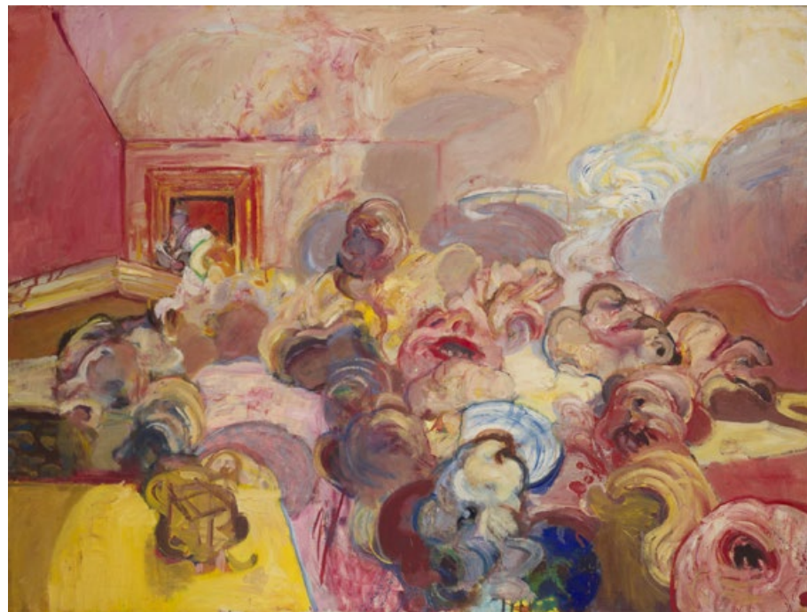
Bez názvu (à la Francis Bacon'), nedatováno, olej, plátno 105 x 140 cm