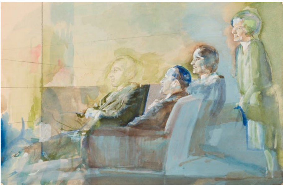
Bez názvu, nedatováno, kvaš, papír, 51 x 33,5 cm