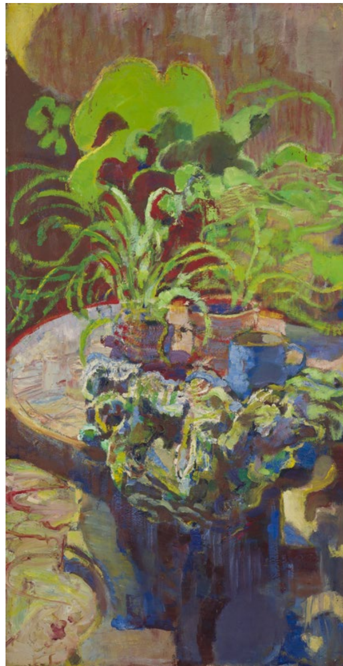
Bez názvu, nedatováno, olej, plátno, 115 x 60 cm