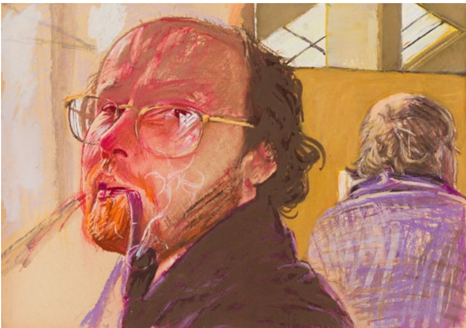
Autoportrét, nedatováno, pastel a akryl na papíře, 50 x 35 cm