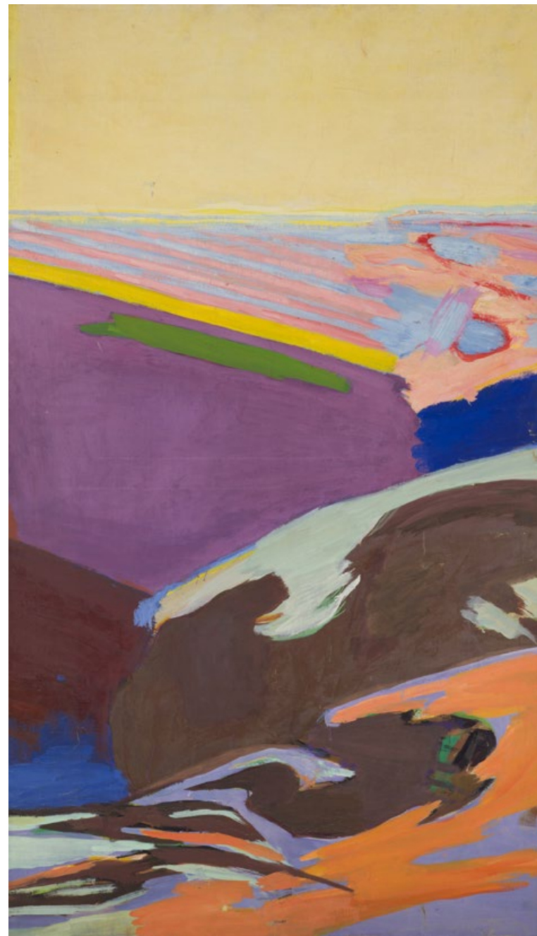
Bez názvu, nedatováno, olej, plátno, 140 x 81 cm