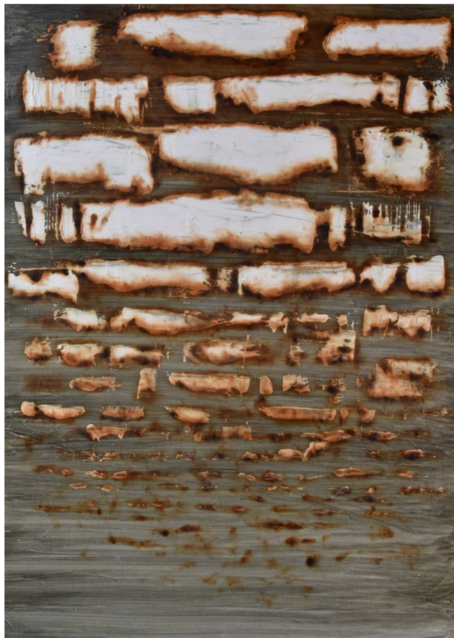
Krajina 3, 2019, akrylové barvy, olej, kouř, plátno, 70 x 50 cm