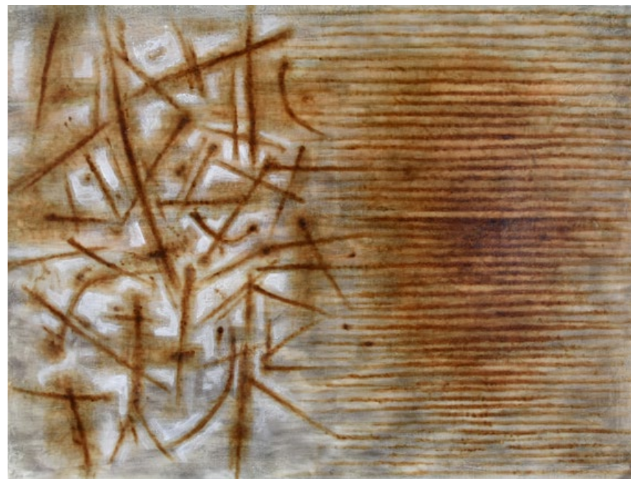
Chrám 3, 2019, akrylové barvy, olej, kouř, plátno, 60 x 80 cm