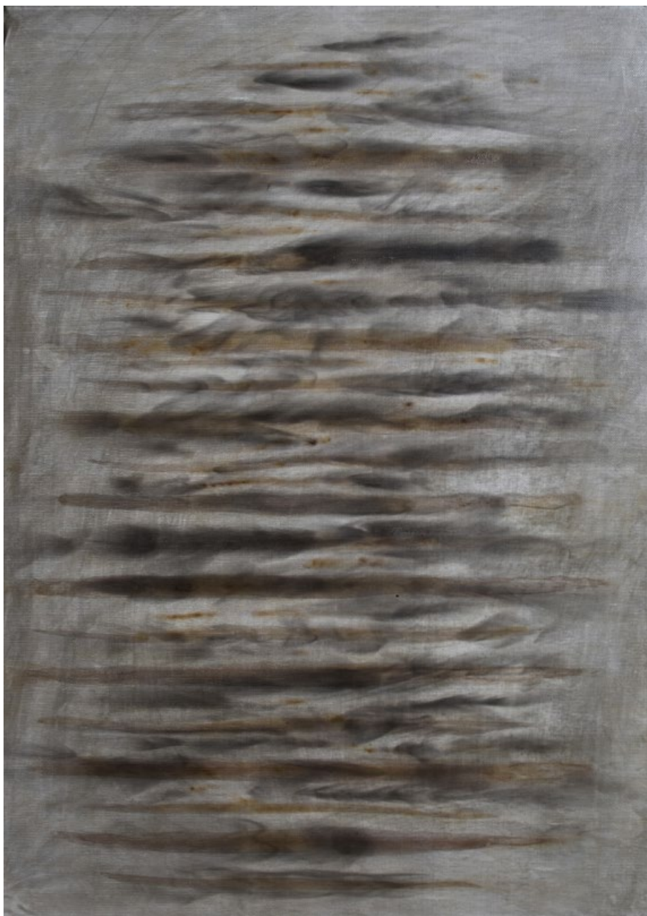
Z cyklu Mlhy, 2018, akrylové barvy, kouř, plátno, 70 x 50 cm