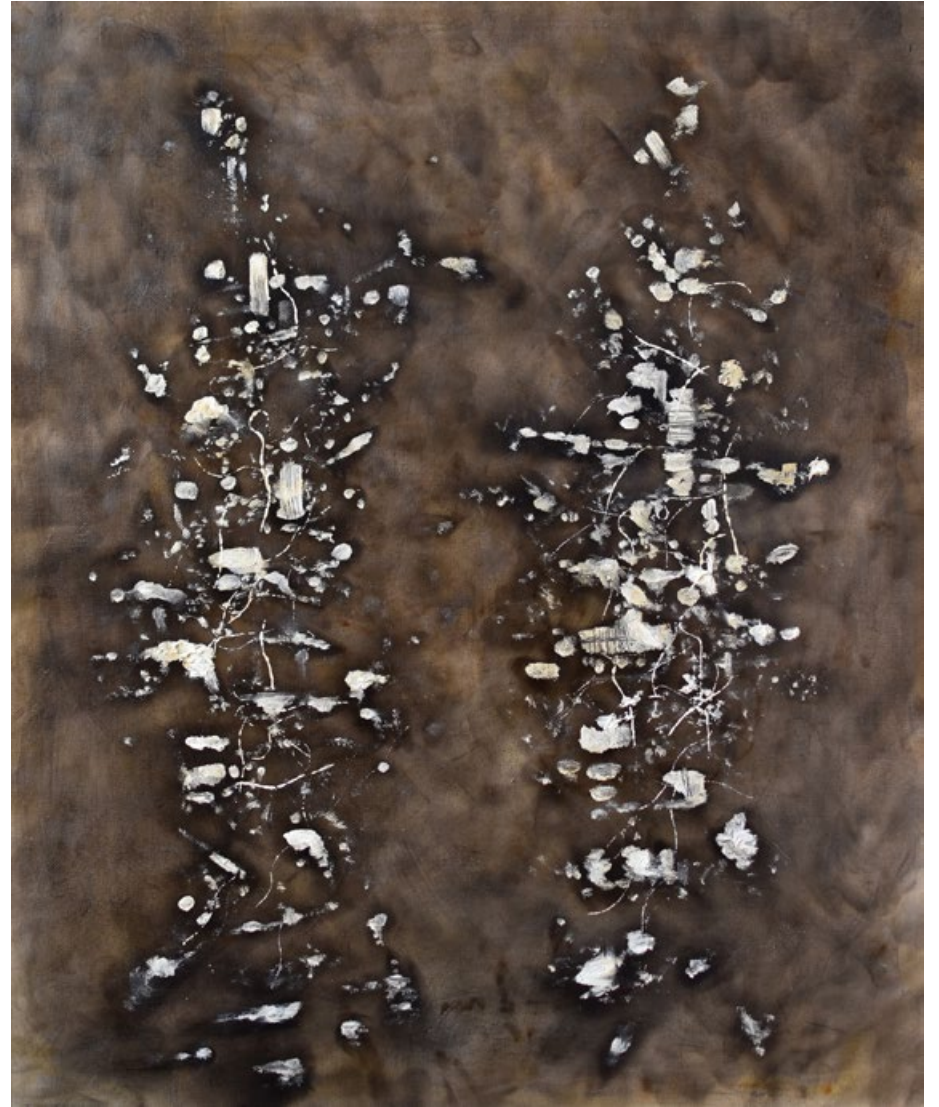
Figury 1, 2018, akrylové barvy, kouř, plátno, 60 x 50 cm