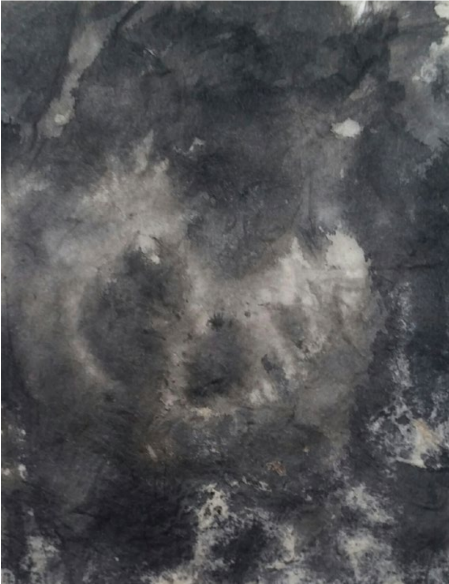
Bez názvu, 2020, záznam tuší, papír, 11 x 8,5 cm