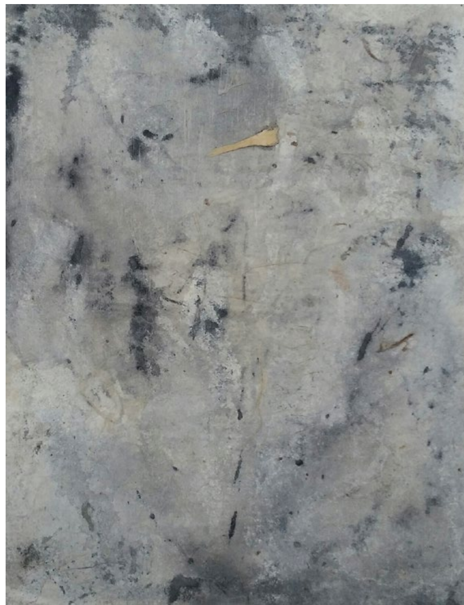
Bez názvu, 2020, záznam tuší, papír, 11 x 8,5 cm