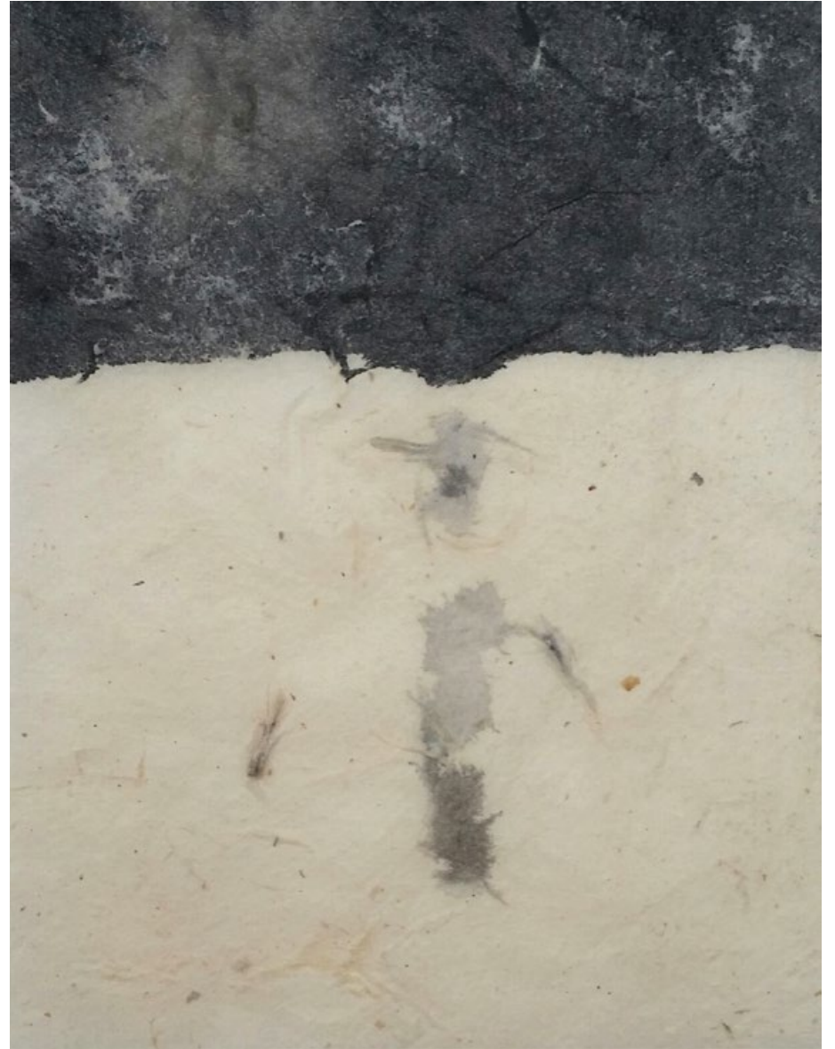
Bez názvu, 2020, záznam tuší, papír, 11 x 8,5 cm