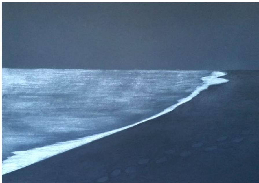
Černá pláž - Island, 2018, pastel na papíře, 70 x 100 cm