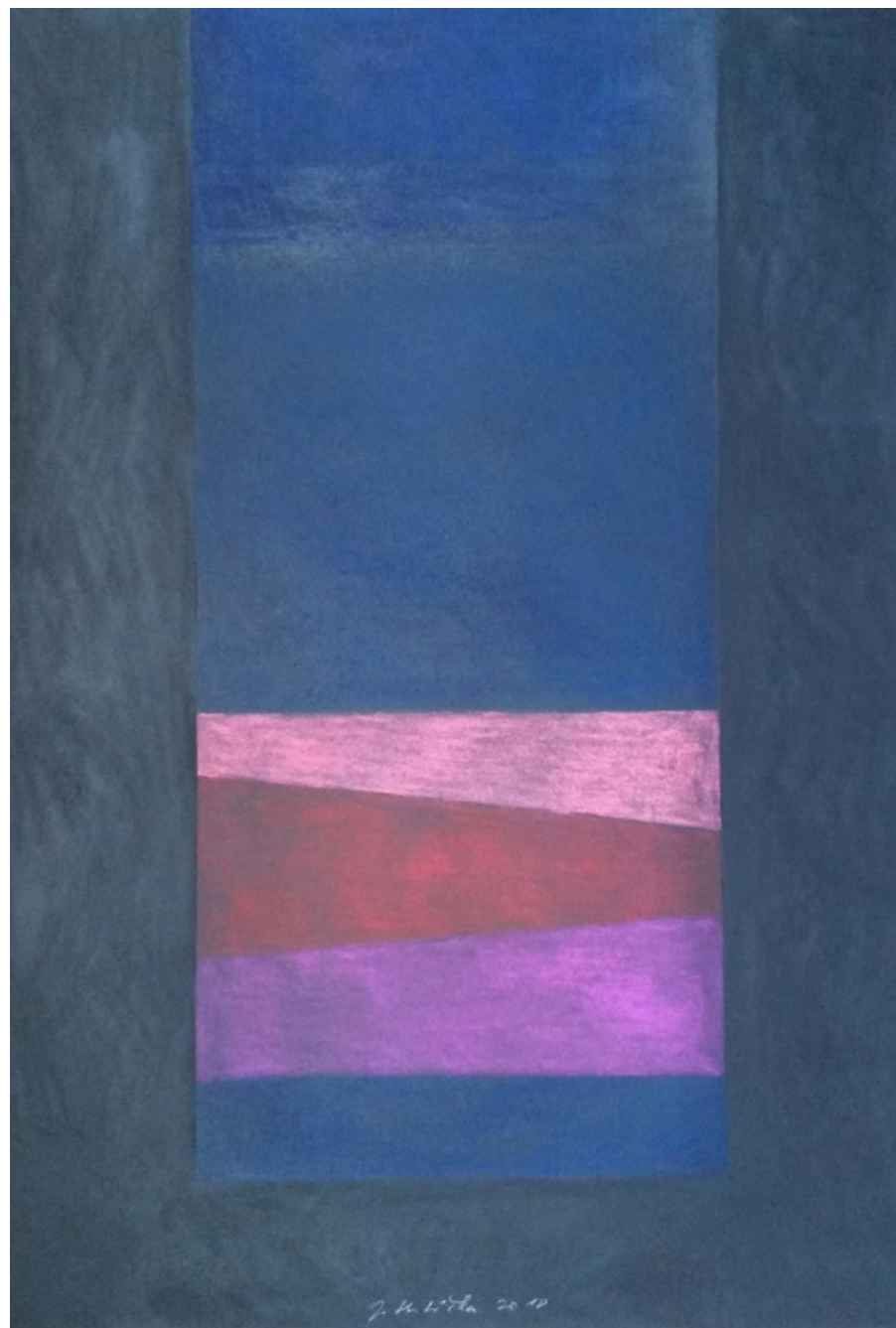
Okno, variace I, 2018, pastel na papíře, 100 x 70 cm