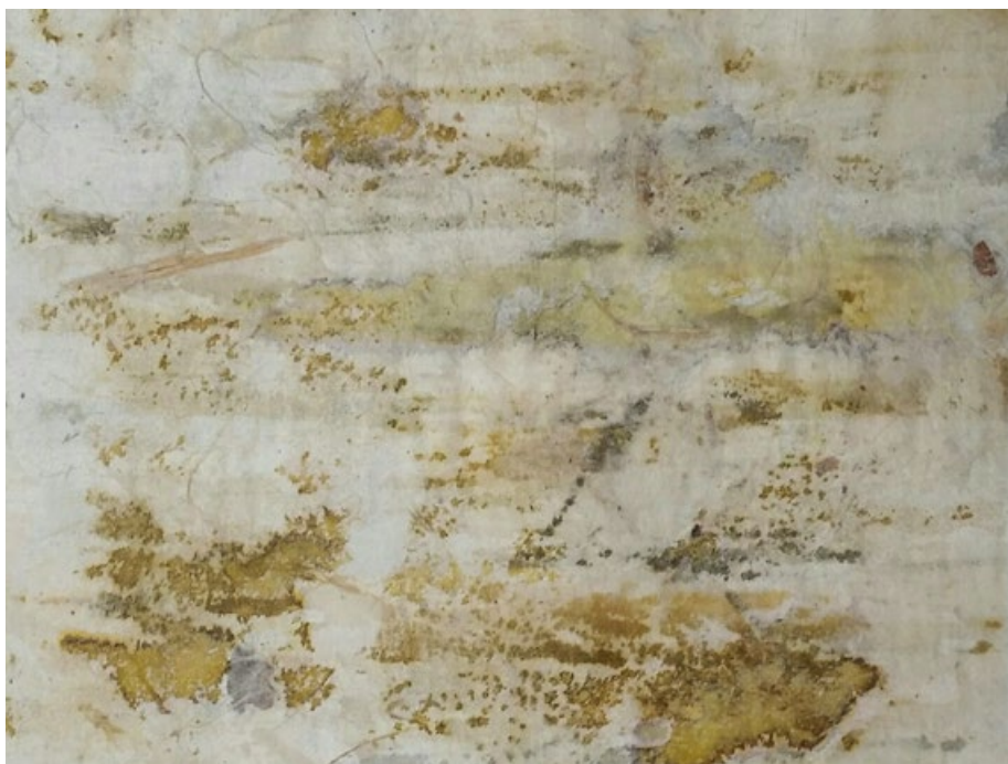
Bez názvu, 2020, sépie, papír, 8.5 x 11 cm